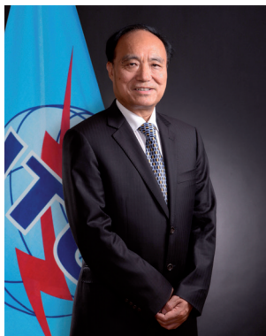
Houlin Zhao ITU Secretary-General March, 2015

It is my pleasure to present the Strategic plan for the Union for 2016-2019.